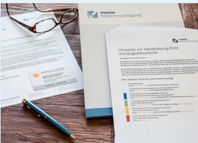
Vorsorgedokumente nach der Onlineerstellung für zu Hause. Notfallkarte optional, siehe unten unter „weitere Leistungen“.